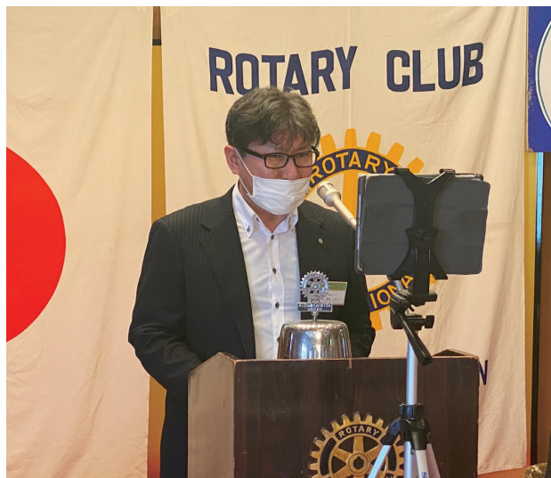
会長・幹事、今月もよろしくお願ひします！