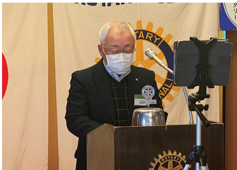
山口プログラム委員長より今月のプログラム発表です。魅力あるプログラムです。