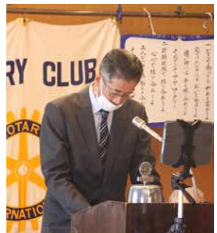
今日も真剣な各委員長の発表です。