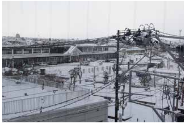
年末年始の大雪のせいもありますね。写真は例会場から見た会津若松駅。