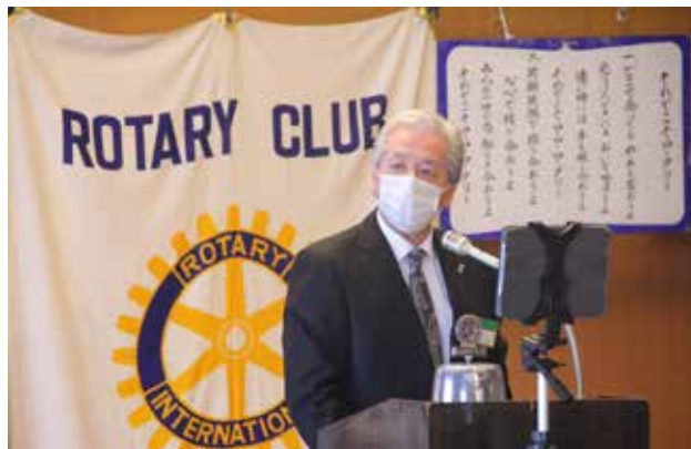
今日もビシッと決まっている湯田会長のご挨拶。