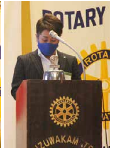
各委員会の委員長より発表です。