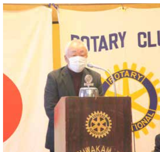
山口プログラム委員長より、 今月のプログラム発表です。