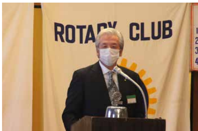
湯田会長のご挨拶。本年もよろしくお願いいたします。