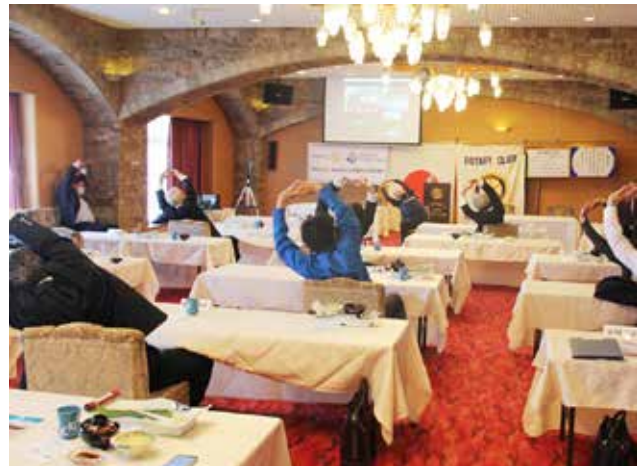
会員みなで、実践。気持ちよく体をほぐします。