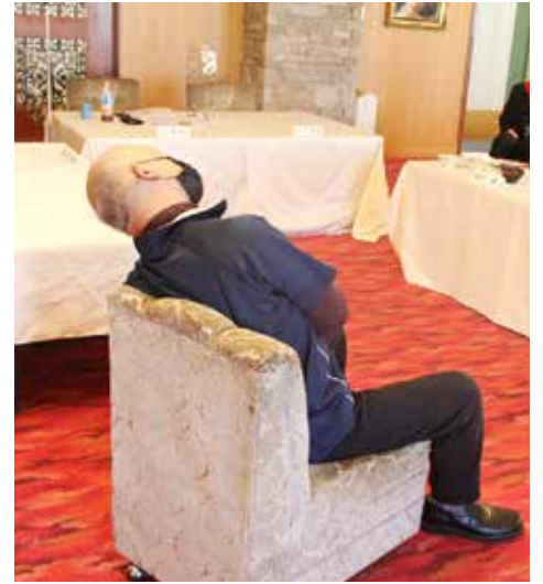
まずは椅子に座ってできる、ストレッチです。