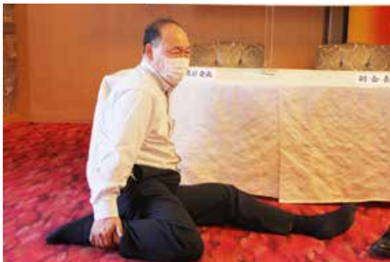
あっけにとられる赤城会員。