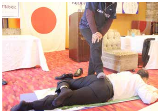
いじめているわけではありません。足がいいんです。