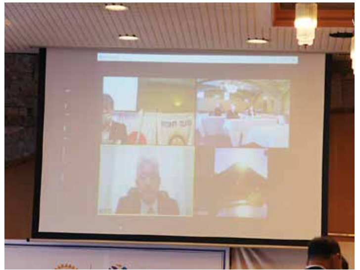
湯田会長のご挨拶。今日もハイブリッド例会です。