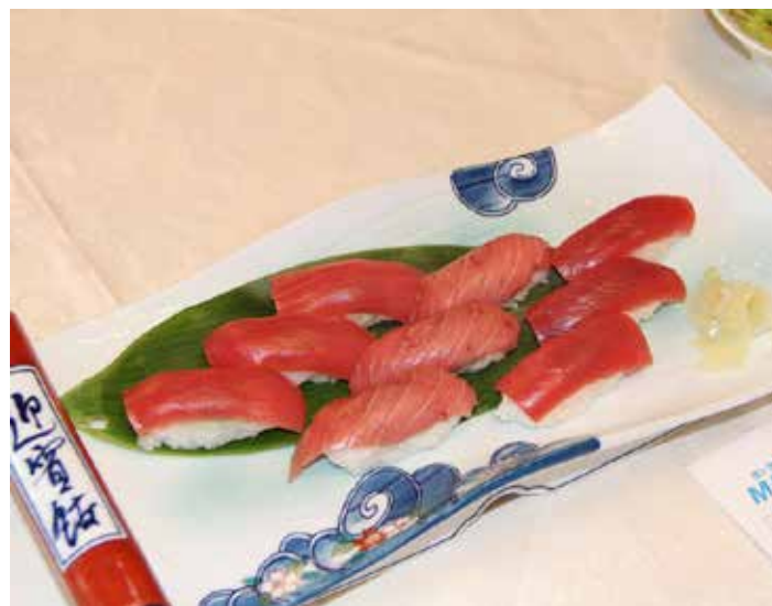
今日は鮭尽くし！迎賓館さんが例会場で良かったです。