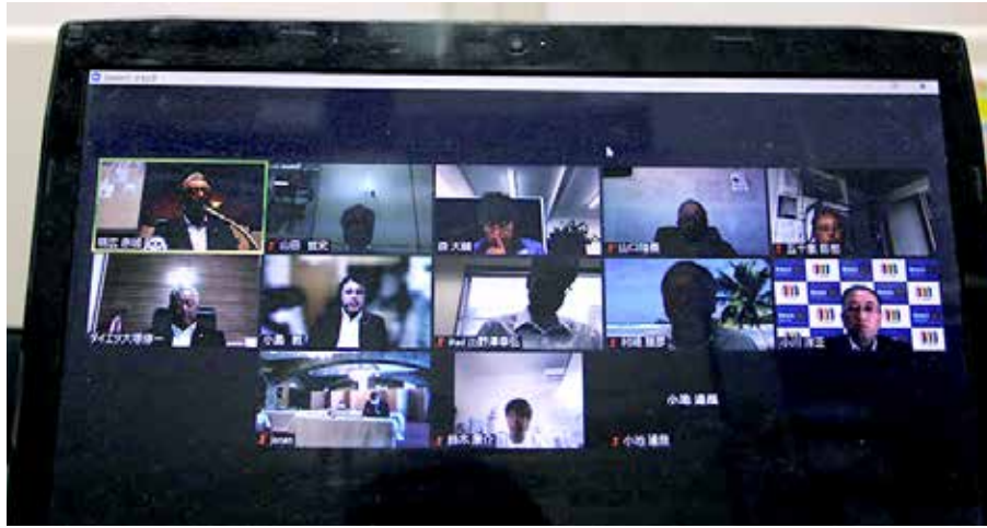
他の会員は、各々リモートで参加です。