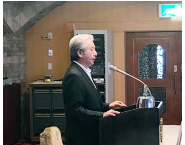
湯田会長のご挨拶です。リモートでも熱い語り口です。