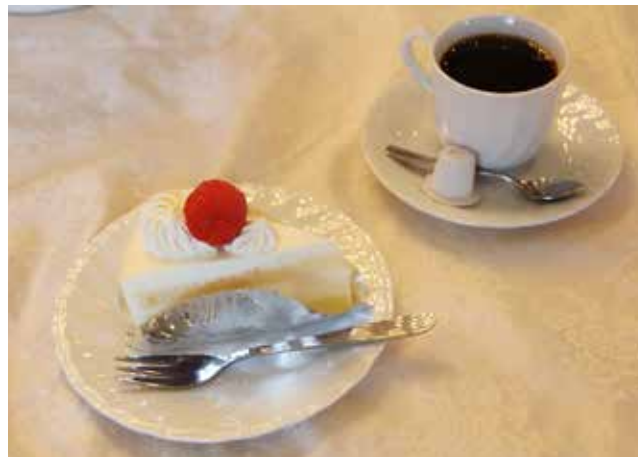
ちょっとブレイク。迎賓館さんのおいしいケーキとコーヒーです。