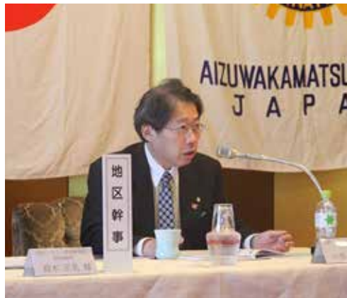
ガバナーよりの確なアドバイスをいただきます。