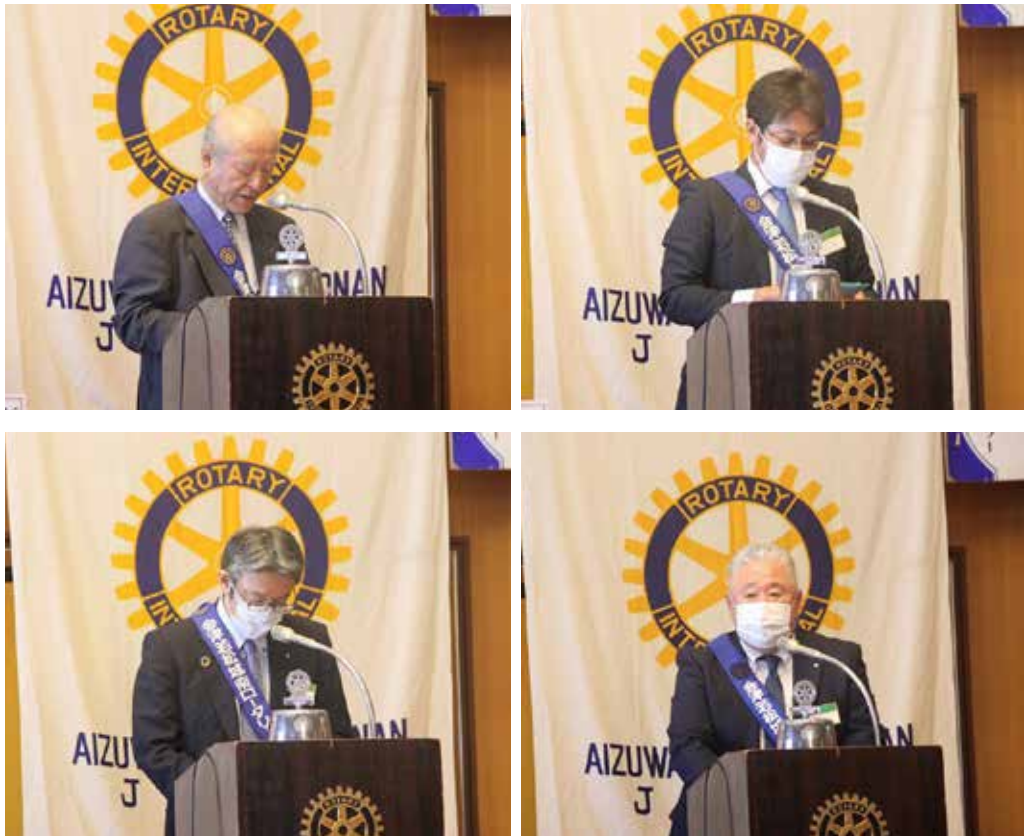
出席・ニコニコ・R財団・米山の各委員長からの発表です。