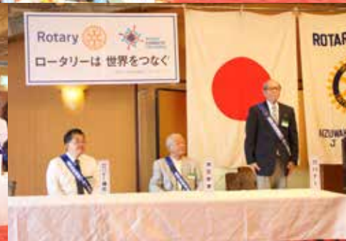
本番さながらに練習。