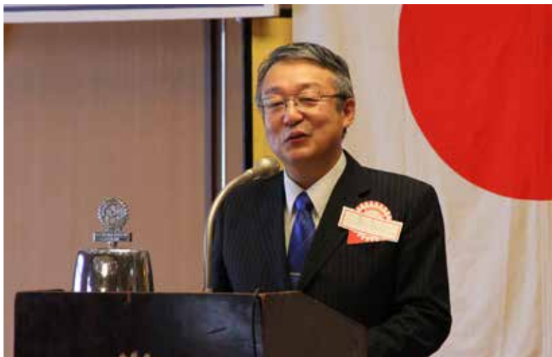
ゲストの星様のスピーチです。ロータリー財団のお話をいただきました。星様は昨年度の会津分区ガバナー補佐を務められ、今年も地区委員として尽力されています。