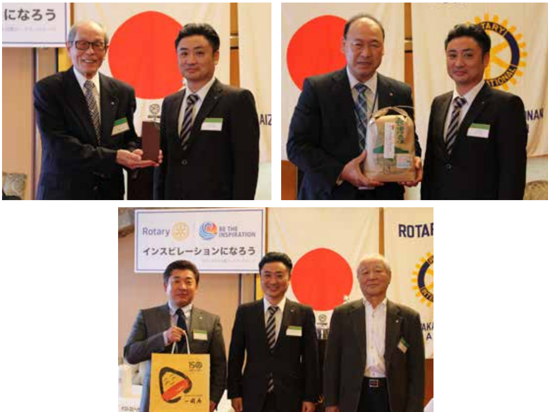
今月の会員誕生、結婚、夫人誕生祝いが贈られました。皆様おめでとうございます！