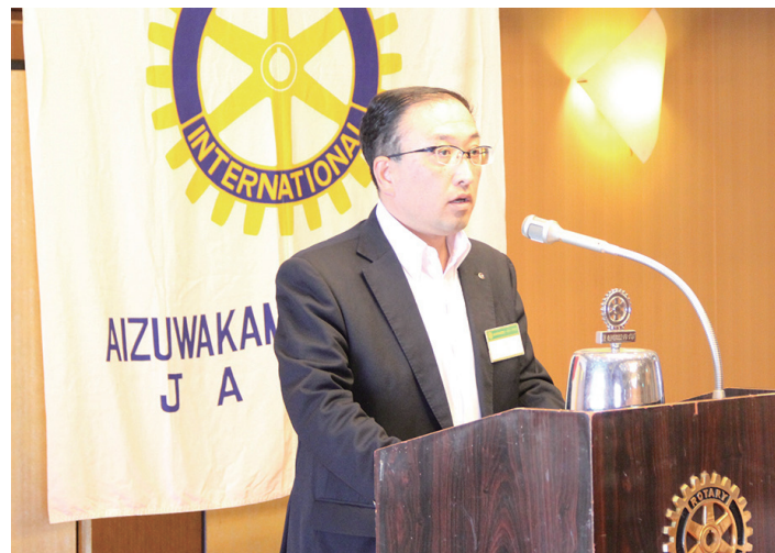
小川会長のご挨拶。