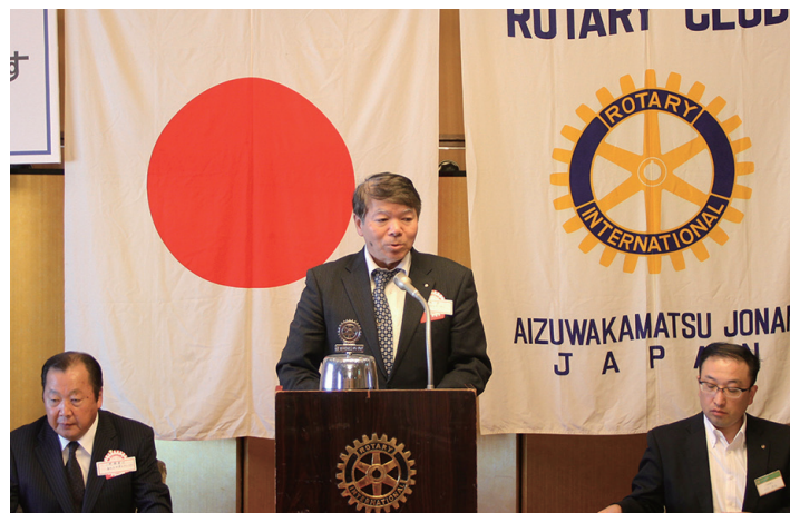
猪苗代RCのお二人からは、分区内の有志クラブ共同で 行った消防行政へのAEDトレーナー寄贈のご案内です。 10月末に贈呈式が行われます。猪苗代RCさんには先頭に 立ってくださってありがとうございました。