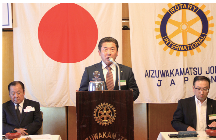
村崎幹事の幹事報告です。