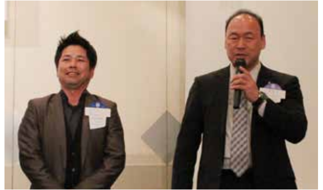
赤城親睦活動委員長。