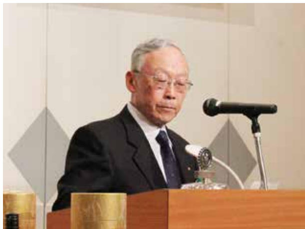
岡崎城南 RC 天野会長です。