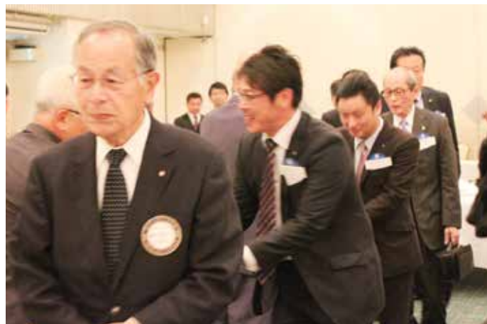
温かい拍手の中、入場です。 会場は素晴らしいホテルです。結婚式場のようです。