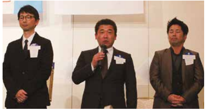
村崎クラブ奉仕委員長。