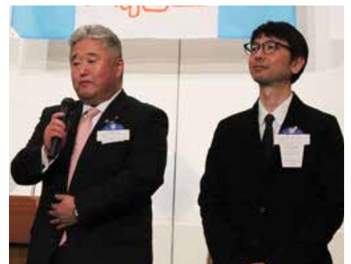
大塚社会奉仕委員長。