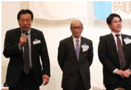
岡本青少年奉仕委員長。