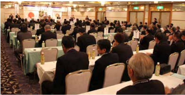
会津分区のロータリアンが一堂に集まる姿は壮観です。