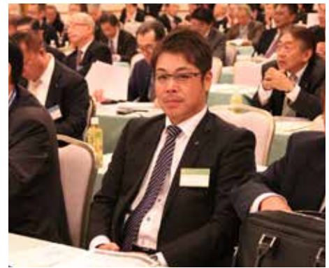
小島会長もキリッと！ 講演を受ける気満々です。