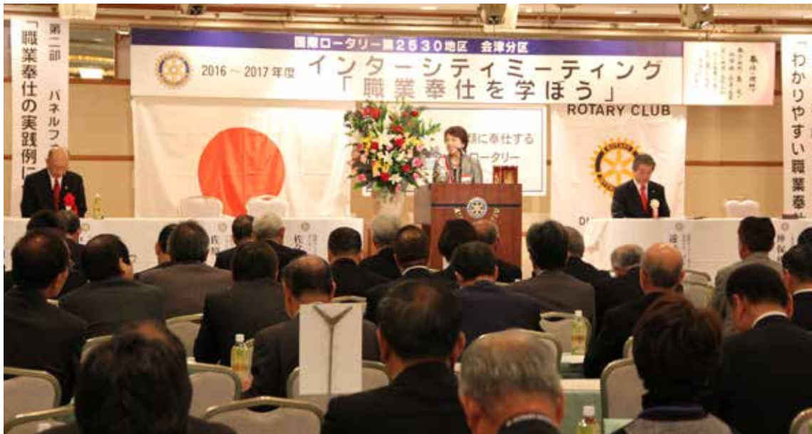
午後からはIM本番。 今回は会津若松中央RCさんがホストクラブで「職業奉仕を学ぼう」がテーマです。