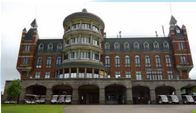
宿泊はゴルフ場併設の高級ホテル「エーヴランドホテル」。