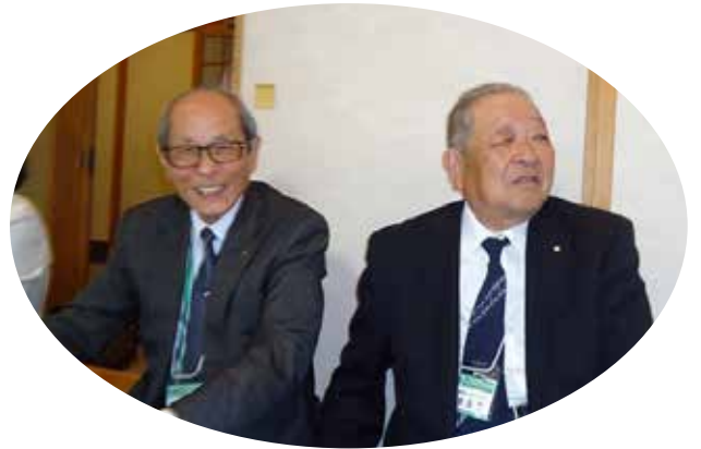
座卓でひざを突き合わせ、親近感が増します。