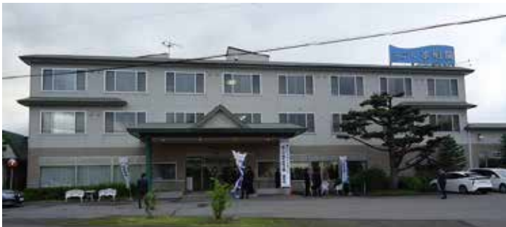
記念式典会場のホテル水明閣。

アサヒビール園にて昼食。 ジンギスカン食べ放題です！ 皆さん最高の笑顔ですねー。