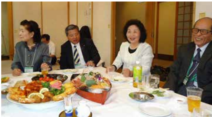
やっぱり北海道の海の幸は最高！