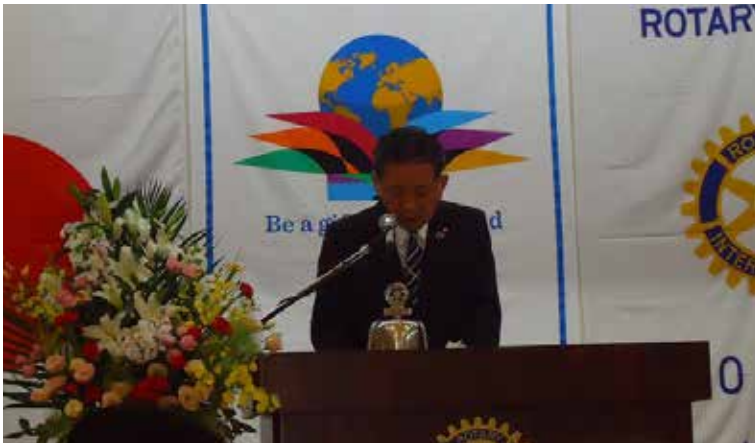
厳かに、盛大に、式典が執り行われました。 55周年、本当におめでとうございます！