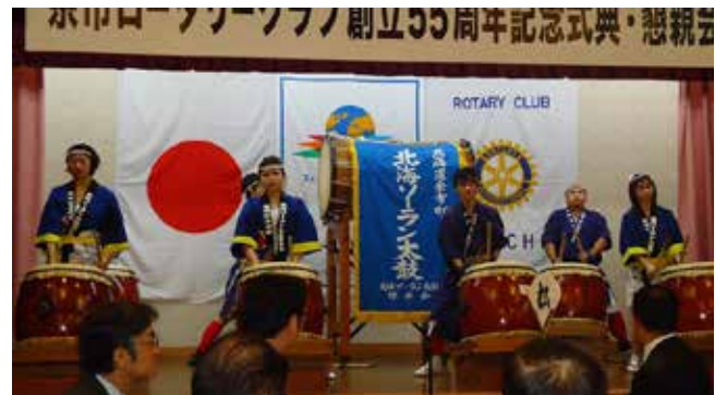
懇親会にて、北海ソーラン太鼓！