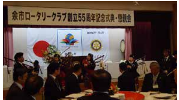
バグパイブ演奏でまた歓迎！