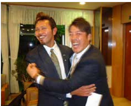
小島エレクトが 北海道のご親戚と対面。