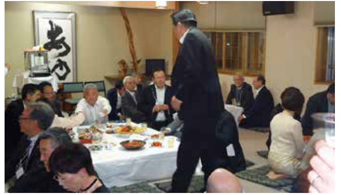
余市RC、岡崎城南RC、当クラブの3姉妹クラブで交流会。