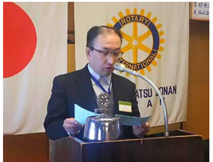
各委員会報告です。