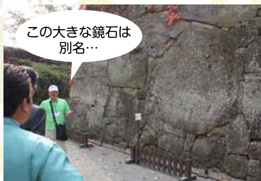
この大きな鏡石は別名…