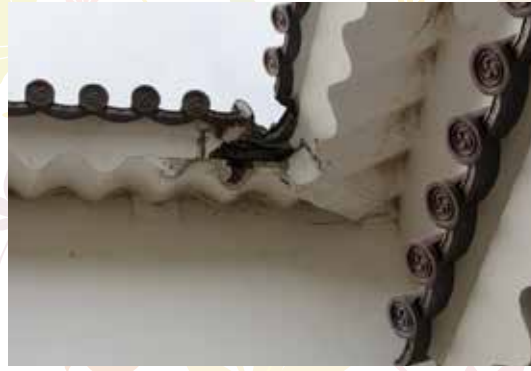
東日本大震災の爪痕も痛々しく残っています。