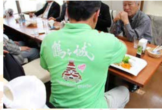
大竹会員登場！いつもの「ガイド服」に身を包み、準備万端です。