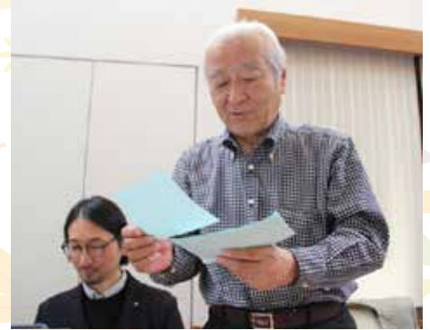
小池会長の挨拶も絶好調です。幹事報告とニコニコBOXも終えて出発です。