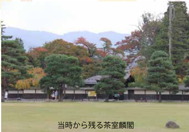
当時から残る茶室隣閣