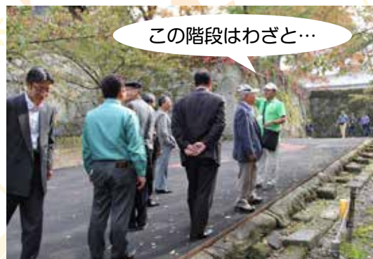
この階段はわざと…