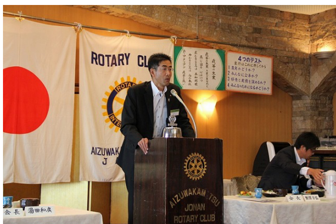
残すところ後わずかの野澤会長の会長挨拶。名残惜しい感が御座います。