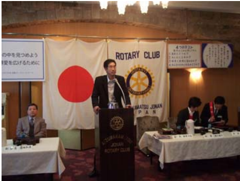
今年度の各委員会の仕事も早くも半分終わりました。来年も半年頑張りましょう。