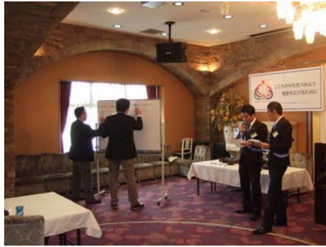
来年度の理事役員の選挙です。