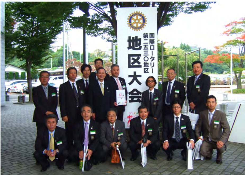
パルセ飯坂前にて集合写真

弘前ロータリークラブの開場慶博氏による「今、ロータリー・ルネッサンスのとき」国家の品格で有名な藤原正彦氏の「日本のこれから、日本人のこれから」共に素晴らしい講演でした。