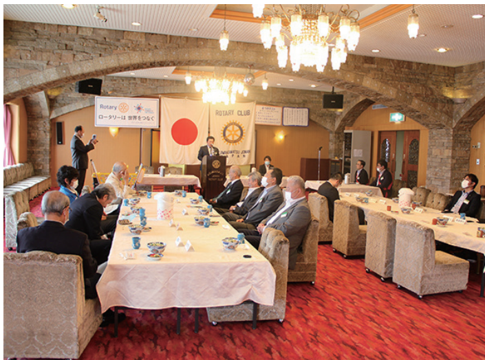
今日は各委員会の活動報告です。