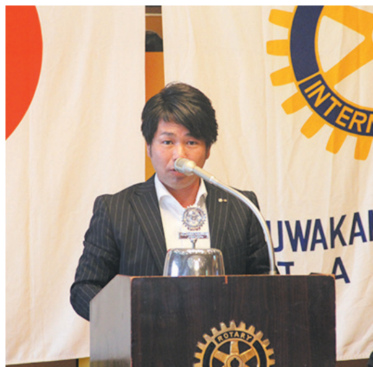
会長幹事、残り2回です。最終までよろしくお願いいたします。