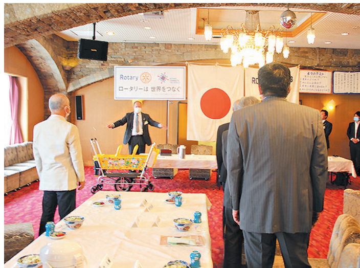
ロータリーソング斉唱では、 赤城会員が次週のソングリードの練習。