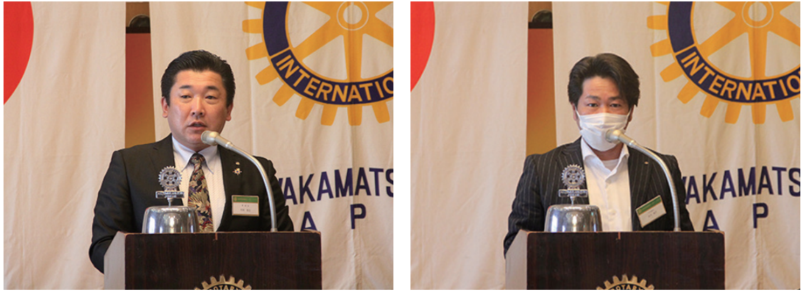
会長挨拶、幹事報告です。

今日は、5月末にリモートで行われた2530地区の地区研修・協議会の報告です。もちろん初の試みでしたが、事前にシミュレーションも行われ、ほとんど混乱はなかったようです。