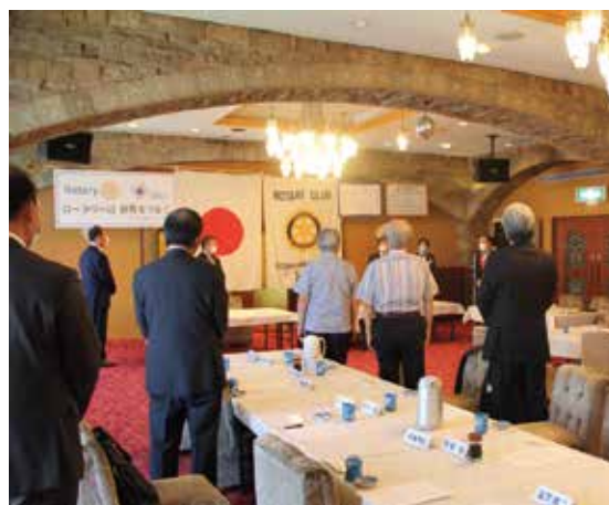
今日も検温、手指消毒をしてからの例会となります。