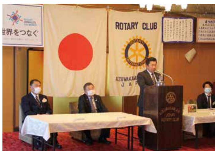
ガバナー補佐と地区幹事が、本日は久しぶりにご訪問。