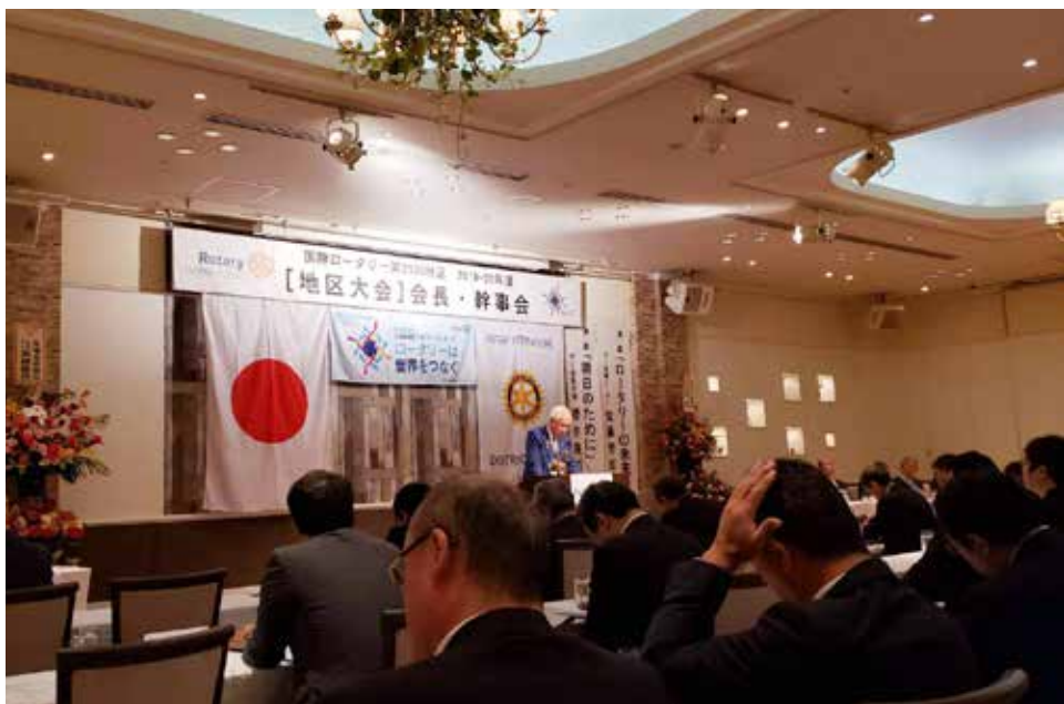
数々の表彰や講話、会議などが開かれた今年も、とても素晴らしい大会になりました！