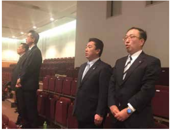
我がクラブの精鋭が出席しました。