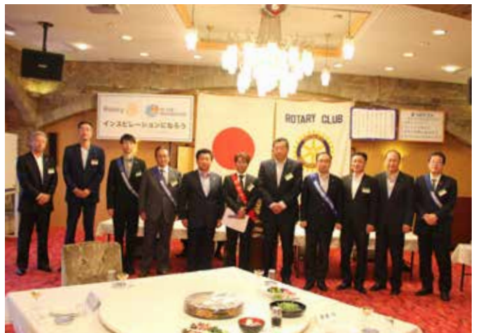
新旧の理事役員。だいぶ連続でやる人も多いようですが、気分も新たにならばいいですね。