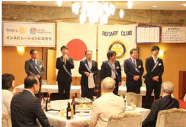
親睦活動委員会の皆様、今夜もがんばってください！