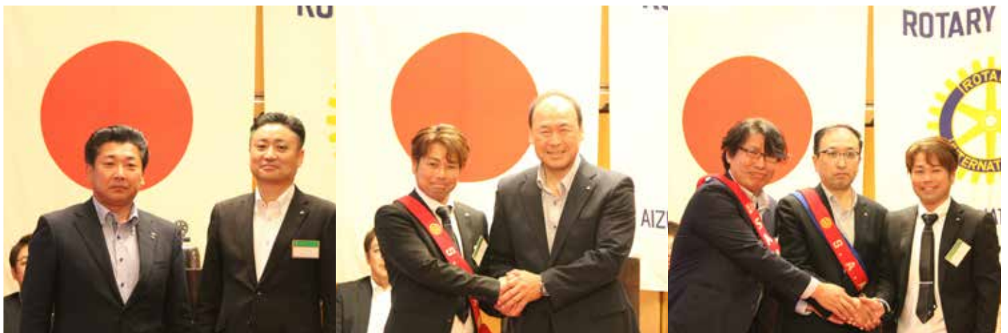
会長、幹事、S.A.A.の新旧交代をしました。皆さん良い笑顔です。