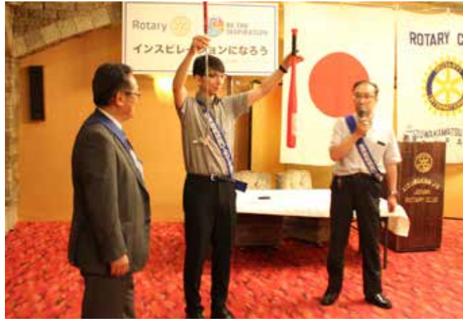
2種類のパター(?)でカップインを目指します。