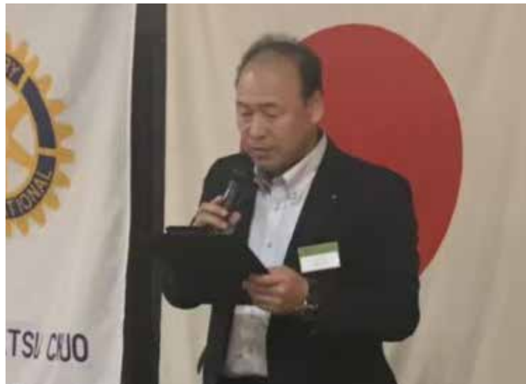
赤城幹事より幹事報告。