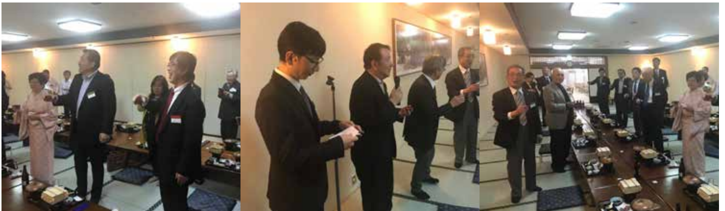
坂田会長が乾杯の音頭。賑やかでいいですね！