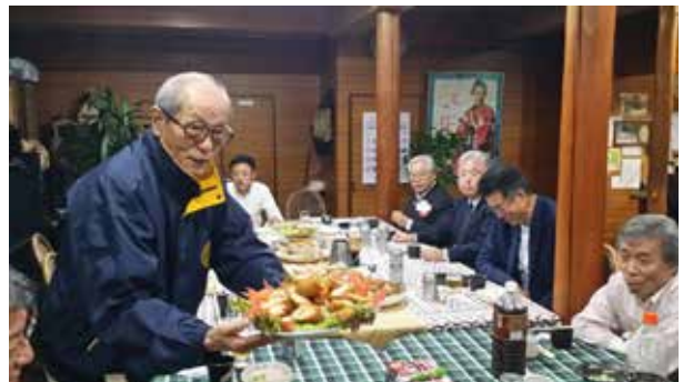
「そばもいいけどカンタンドさんの料理もうまいよ！」 と薦める黒澤会員。