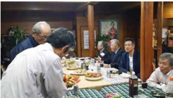
「あー、そばまだかなー。」