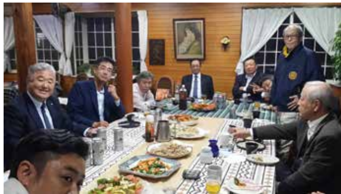
皆、そばを心待ちにしてニコニコです。